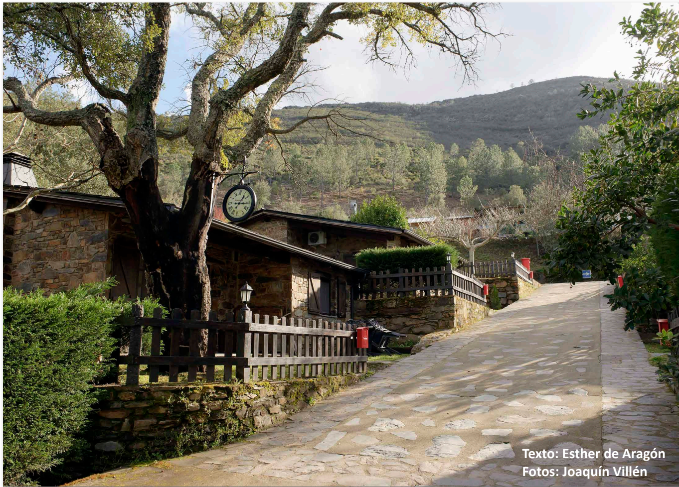
Texto: Esther de Aragón

Durante un tiempo, el Complejo de Turismo Rural cambiará su imagen con la incorporación de detalles propios de tierras de la costa norte del Canal de la Mancha. La causa no es otra que el programa de campamentos de verano “English Factory Kids” del Proyecto Eduka. Riomalo es uno de los centros del Proyecto, y el campamento que acoge desarrolla una metodología especial, orientada a que los participantes aprendan inglés y lo hablen en todo tipo de situaciones. Así hablan ellos mismos del lugar: “El Pueblo Inglés Riomalo de Abajo (Cáceres), lindando con el Parque Natural de las Batuecas-Sierra de Francia, y puerta de una de las regiones más bellas y desconocidas de nuestro país, Las Hurdes. Un entorno idílico, que nos ayuda a vivir la enseñanza del inglés de una forma espontánea, con grandes dosis de diversión e inmersos en un contexto aventurero”.