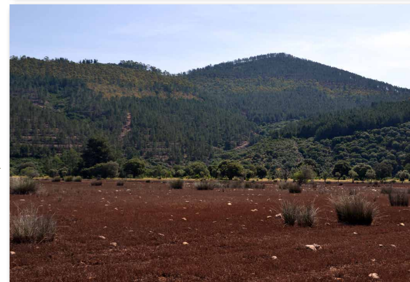
Texto y fotos: Esther de Aragón